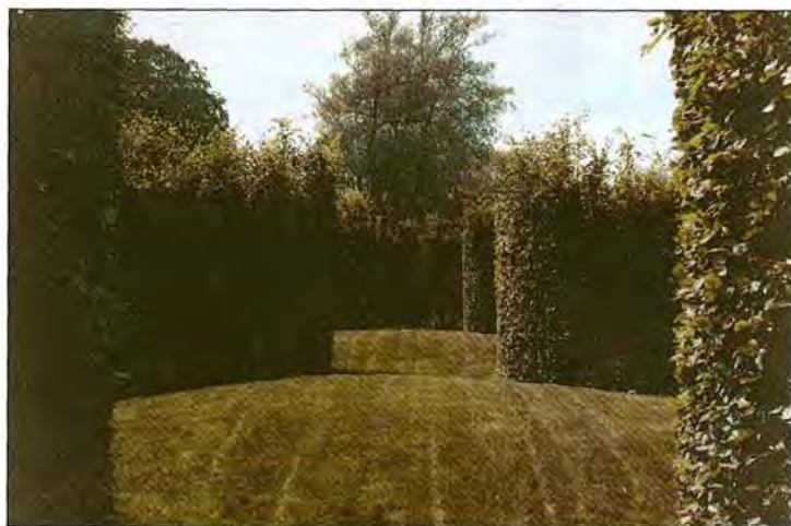
De slangentuin aan de achterkant van het kasteel