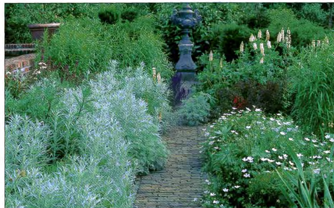
Naast de langwerpige waterpartij ligt een lange, kleurrijke border