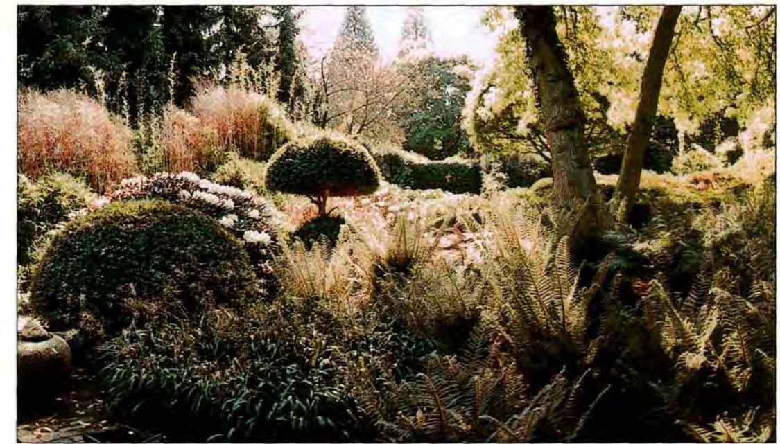
Voor een tuinarchitect is een grote plantenkennis onontbeerlijk

"Een tuin ontwerpen en aanleggen zijn twee verschillende zaken, die volgens mij niet echt samen gaan. Dit is een principiële kwestie. De hele dag buiten werken en 's avonds een beetje ontwerpen,