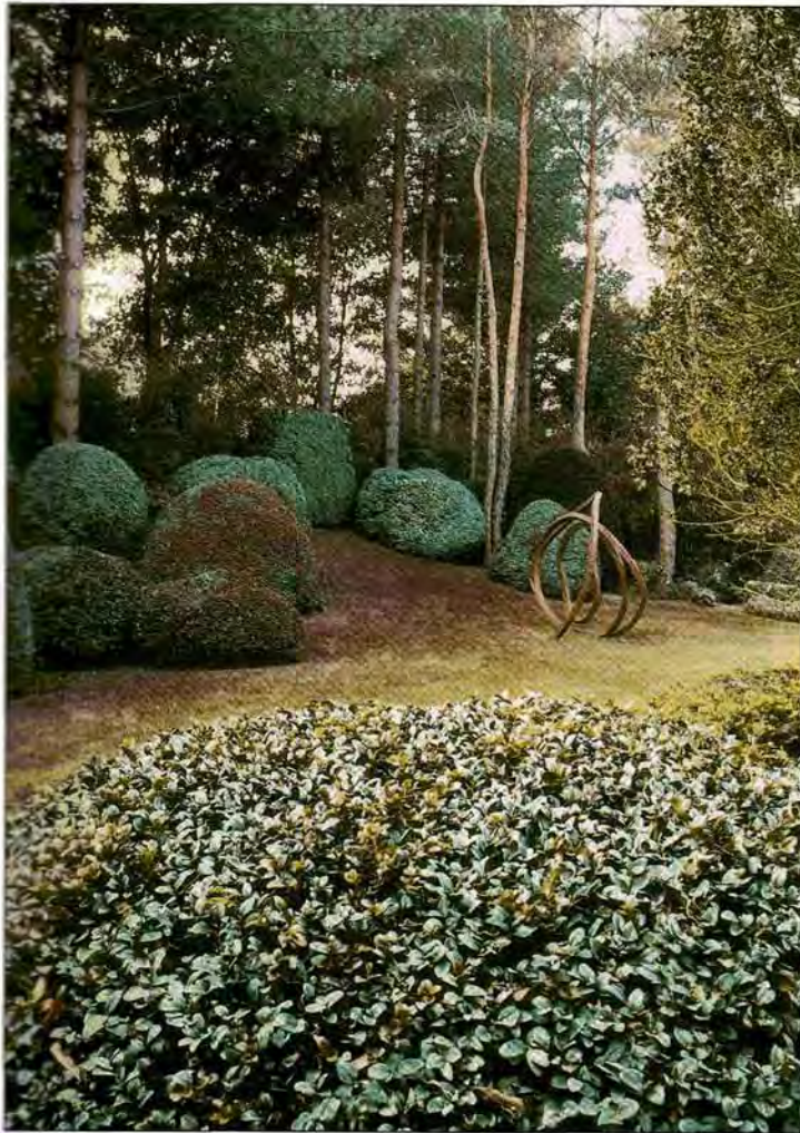
Piet Blanckaert ontwerpt 'Engels geïnspireerde' tuinen

Voor Piet Blanckaert vormt de Engelse tuinarchitectuur, met zijn strakke structuren, afgesloten compartimenten, mooie snoeivormen en - vanaf de prille lente - een ongekende bloemenpracht een permanente inspiratiebron. De Brugse tuinarchitect etaleert ook een grote plantenkennis, volgens hem een vereiste om het vak goed te beoefenen. Zijn voorliefde voor een plant als buxus hoeft weinig commentaar: 'het is gewoon de mooiste plant'. Hij is nu ruim twintig jaar als tuinarchitect actief en nog steeds is hij bereid om bij te leren, om te experimenteren.