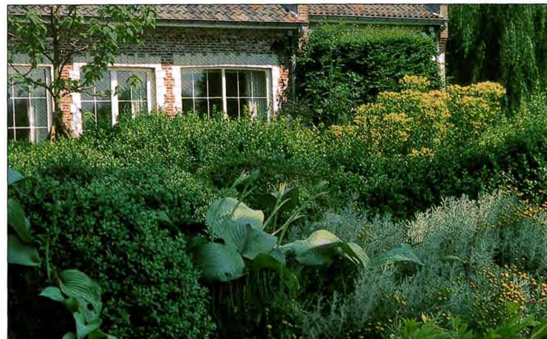
Deze West-Vlaamse tuin telt vijf niveaus