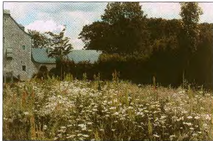
'Bloemen zijn de saus van een tuin' (bloemenweide kasteel Chantraine)

De binnentuin werd volledig nieuw aangelegd. Ik begon te ontwerpen vanaf een grote (nieuwe)