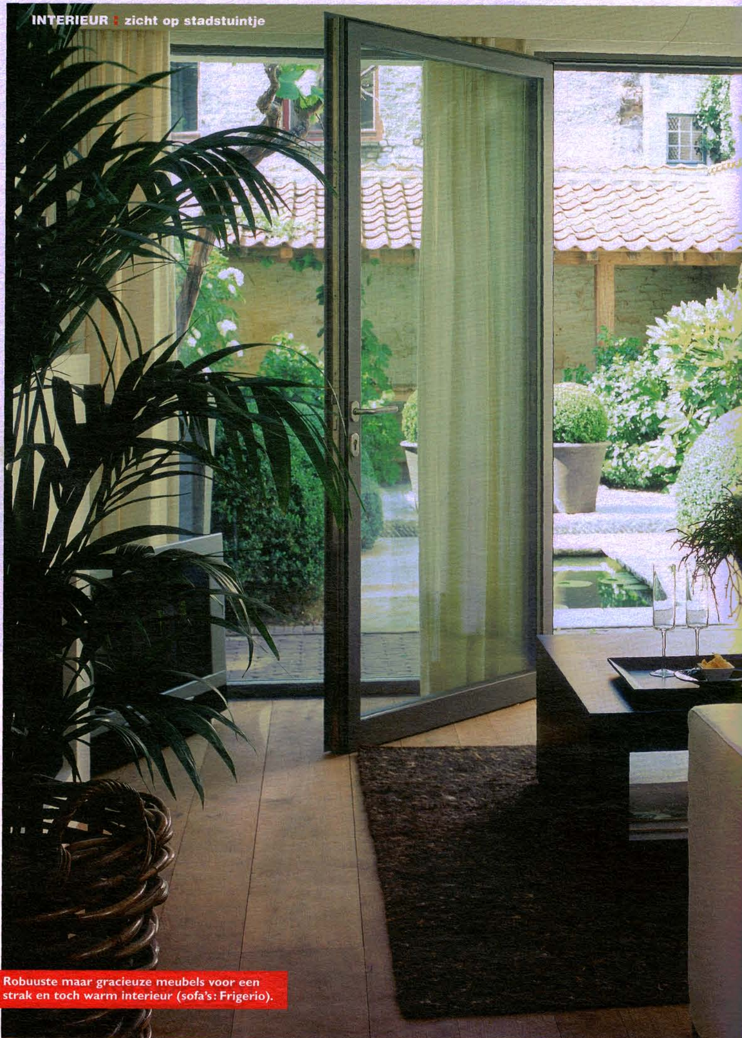
Robuuste maar gracieuze meubels voor een strak en toch warm interieur (sofa's: Frigerio).