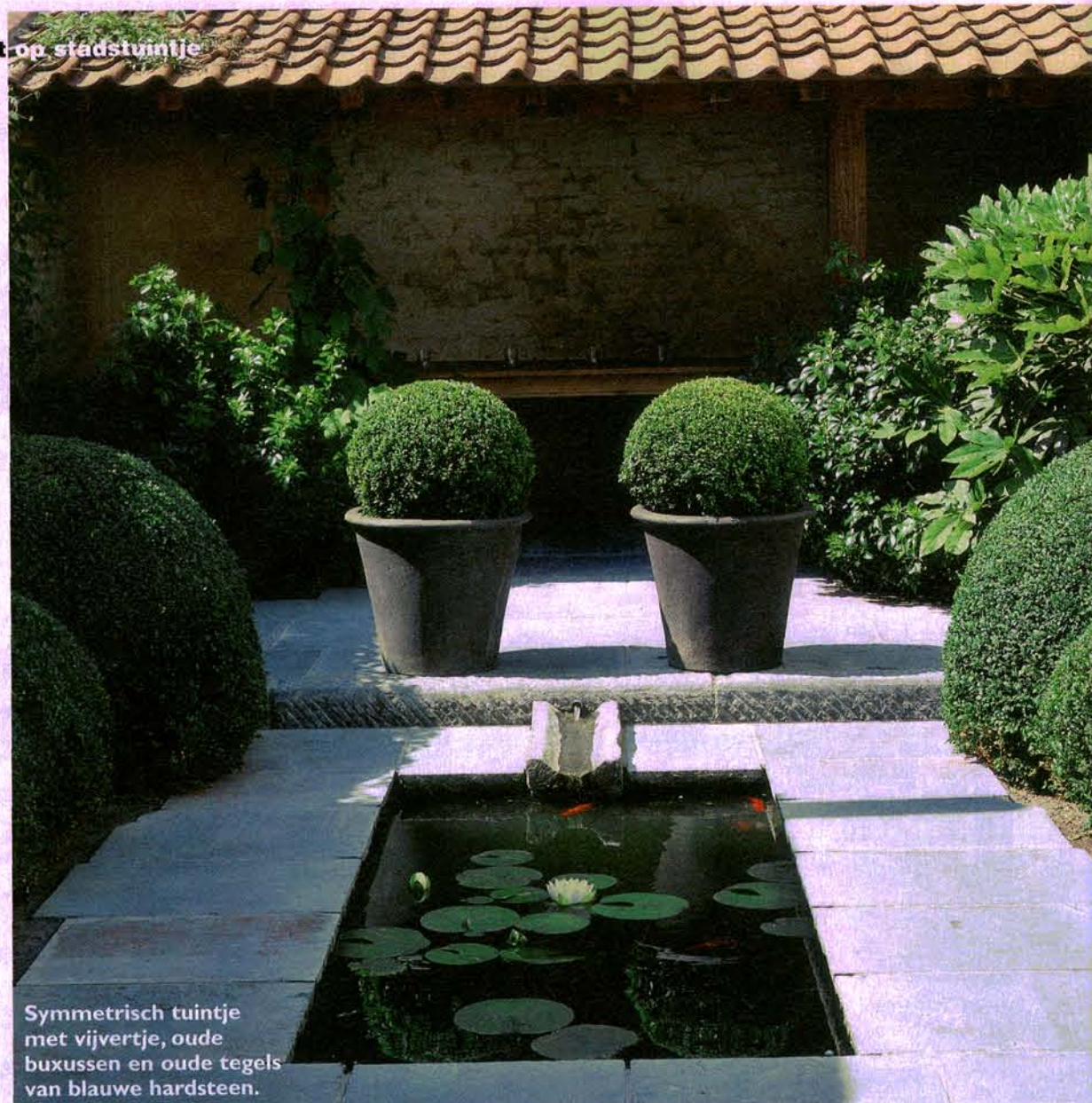
Symmetrisch tuintje met vijvertje, oude buxussen en oude tegels van blauwe hardsteen.