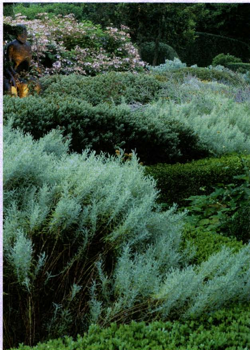
Binnen de driehoek van het terrein zette Piet Blankaert een twaalftal vierkanten van buxussen, met daarbinnen diagonaal dezelfde planten.