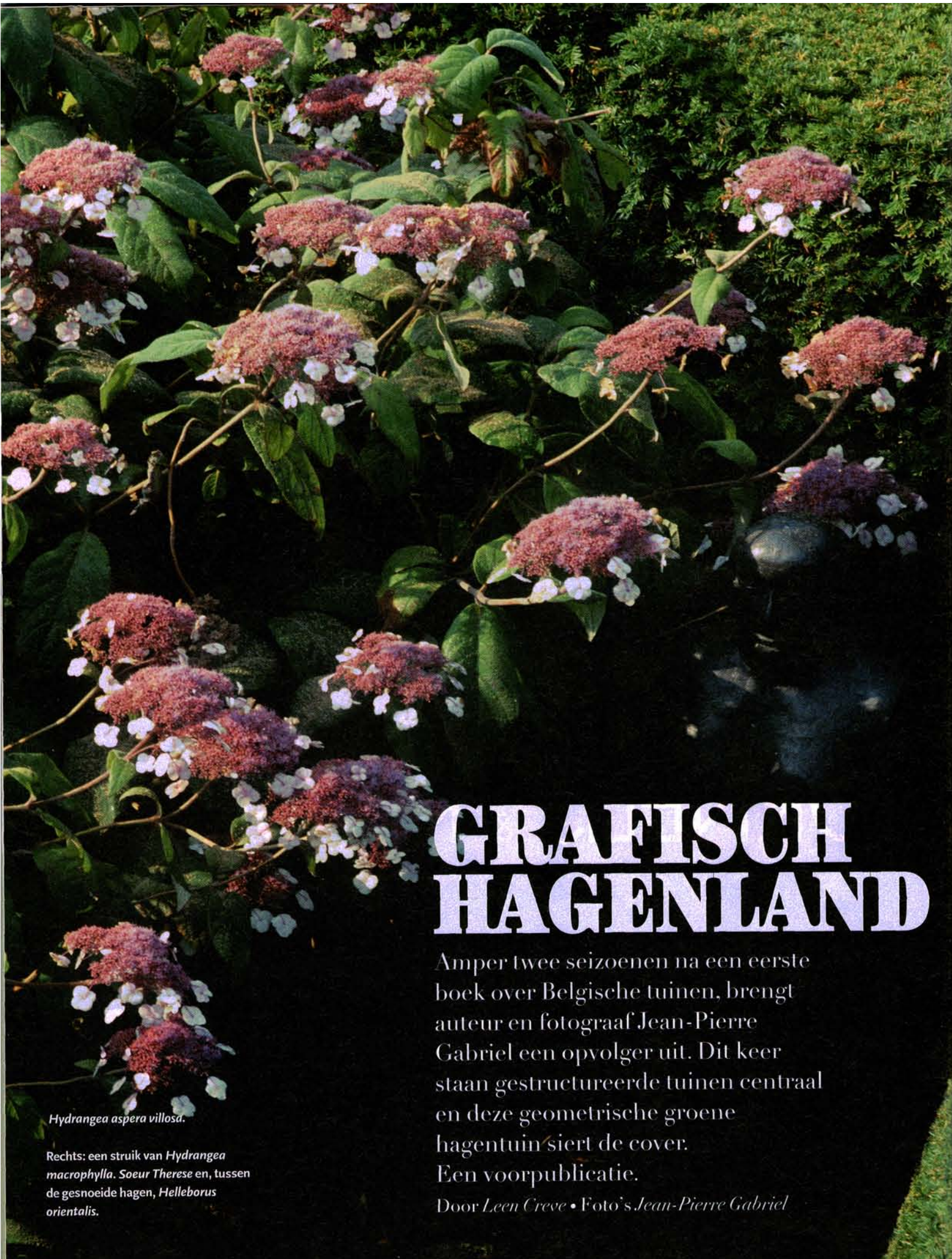
Hydrangea aspera villosa.