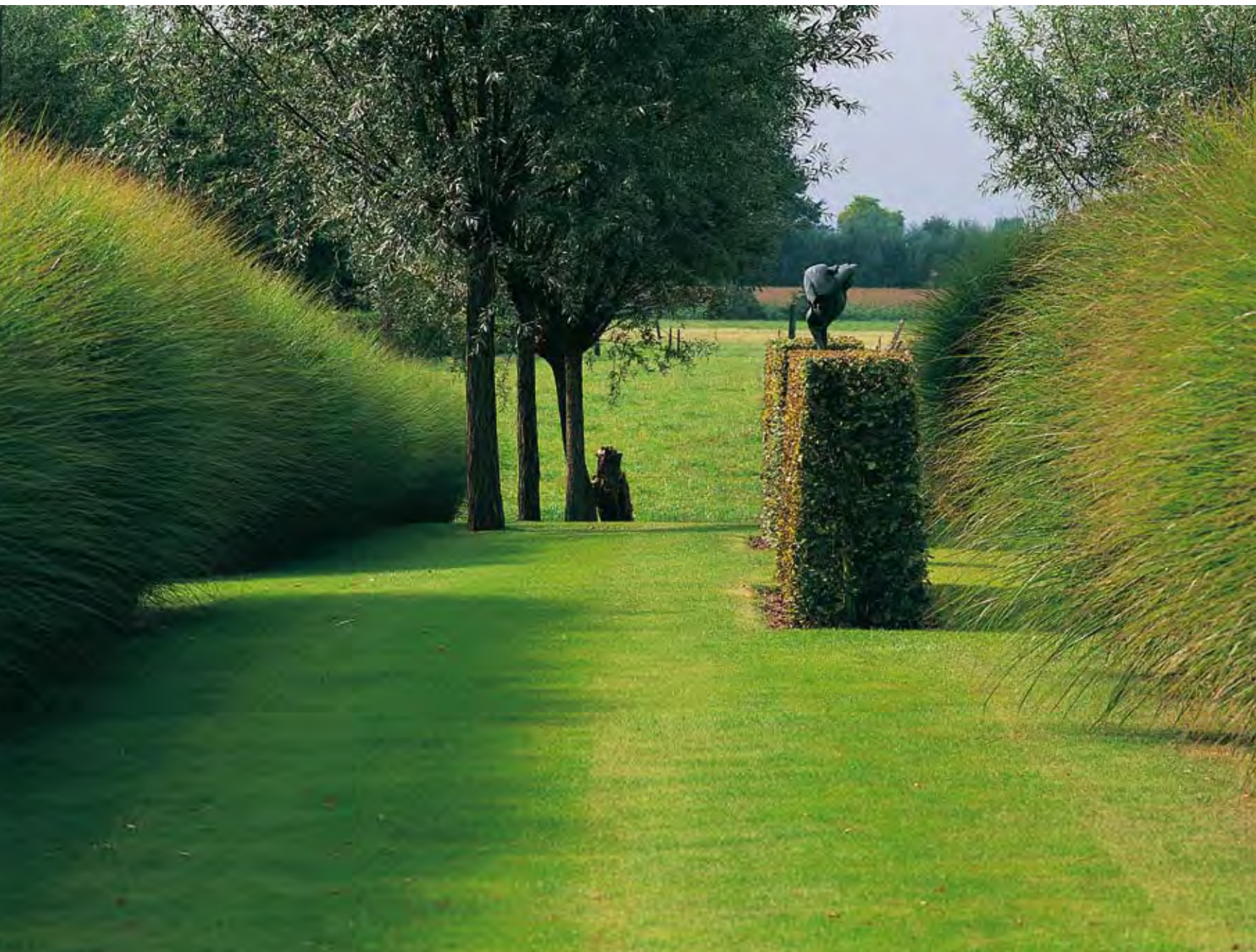
Les hautes Miscanthus sinensis 'Gracillimus', au port arrondi, souples et légères, tracent l'allée et guident le regard vers le lointain. Se promènent trois saules ( Salix alba ) et une sculpture supportée par des charmes ( Carpinus betulus ).

coupe au ras des plants leur donnera une nouvelle poussée de sève. Fini les feuillages, c'est une succession de touffes ressemblant à des oursins qui honorent les plates-bandes. Les saules ont leurs branches coupées au ras du tronc. Seul subsiste le mouvement des branches des bouleaux. Voici plus de dix ans que ce jardin a pris racine. Bien pensé dès le départ, il doit aussi son harmonie et sa grâce à son osmose avec les bâtiments. Le positionnement des plantes offre partout une perspective au regard. Ses propriétaires ne se lassent pas d'admirer ce paysage en mouvement, depuis