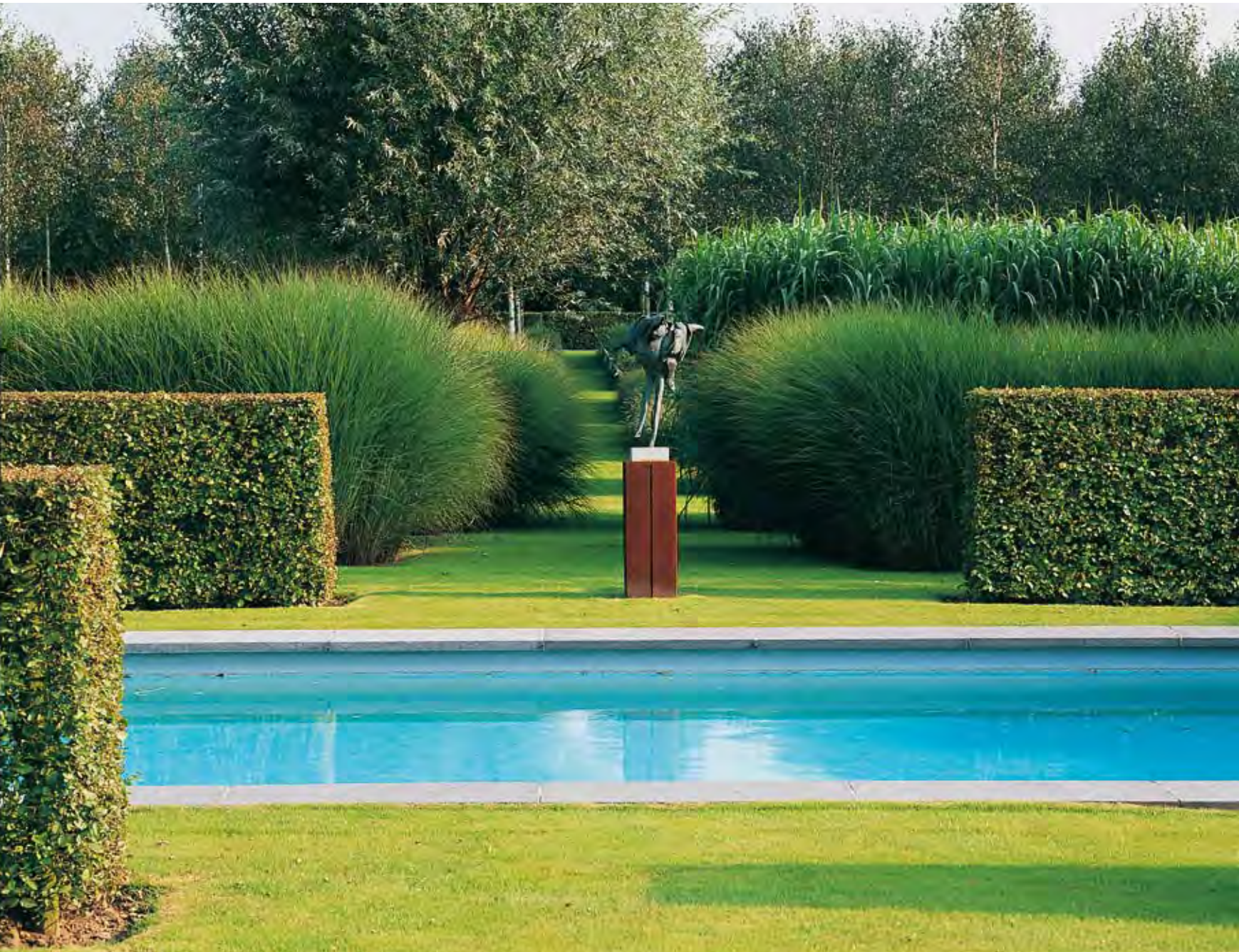
Le foisonnement des graminées encadre une sculpture qui, du haut de sa stèle, semble prête à s'envoler vers la piscine. Une haie de charmes ( Carpinus betulus ) crée une intimité et souligne la structure du bassin.

Se déroulant devant la maison, de larges étendues de graminées embrassent d'un seul coup le jardin. L'effet visuel est saisissant. Les propriétaires en rient et s'étonnent encore aujourd'hui. Ils avaient peu de connaissances au sujet des plantes et ne désiraient qu'une seule chose : « avoir un jardin qui ne demande aucun entretien » ! Passionnés d'architecture contemporaine, ils avaient fait réaliser une maison d'un seul niveau à grandes fenêtres. Ce n'est que lorsque leur enfant eut quitté ses jeux d'enfance que le désir de créer un