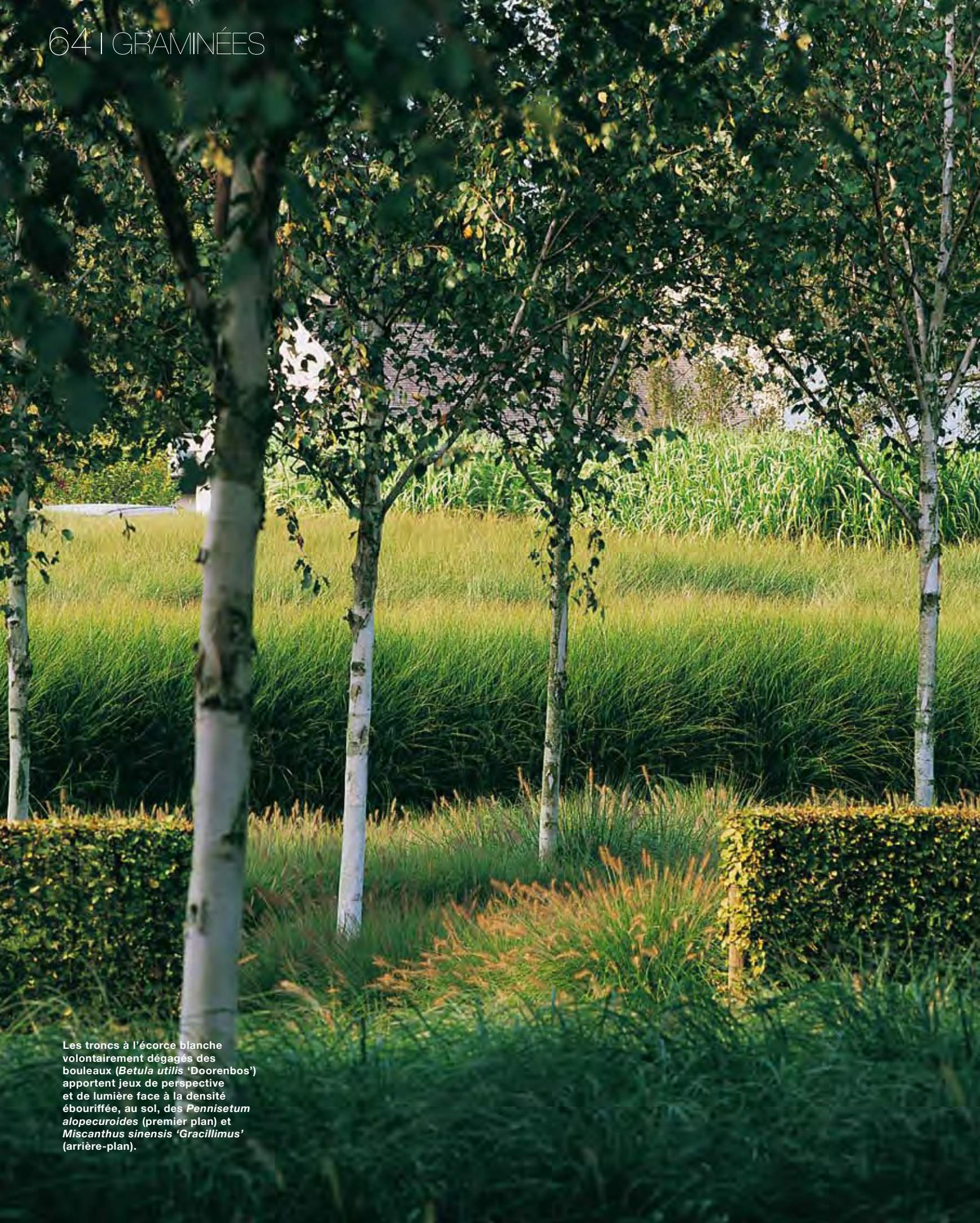
Les troncs à l'écorce blanche volontairement dégagés des bouleaux ( Betula utilis 'Doorenbos') apportent jeux de perspective et de lumière face à la densité ébouriffée, au sol, des Pennisetum alopecuroides (premier plan) et Miscanthus sinensis 'Gracillimus' (arrière-plan).