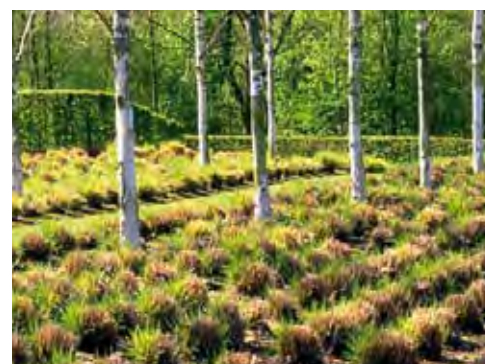
De gauche à droite : Les buissons touffus font oublier la rigueur d'un jardin tiré au cordeau. Les lignes remodelées du ruisseau font office de frontière avec le champ du voisin. Au printemps, toutes les graminées sont taillées au pied afin de redonner la poussée de sève nécessaire à leur bon développement.